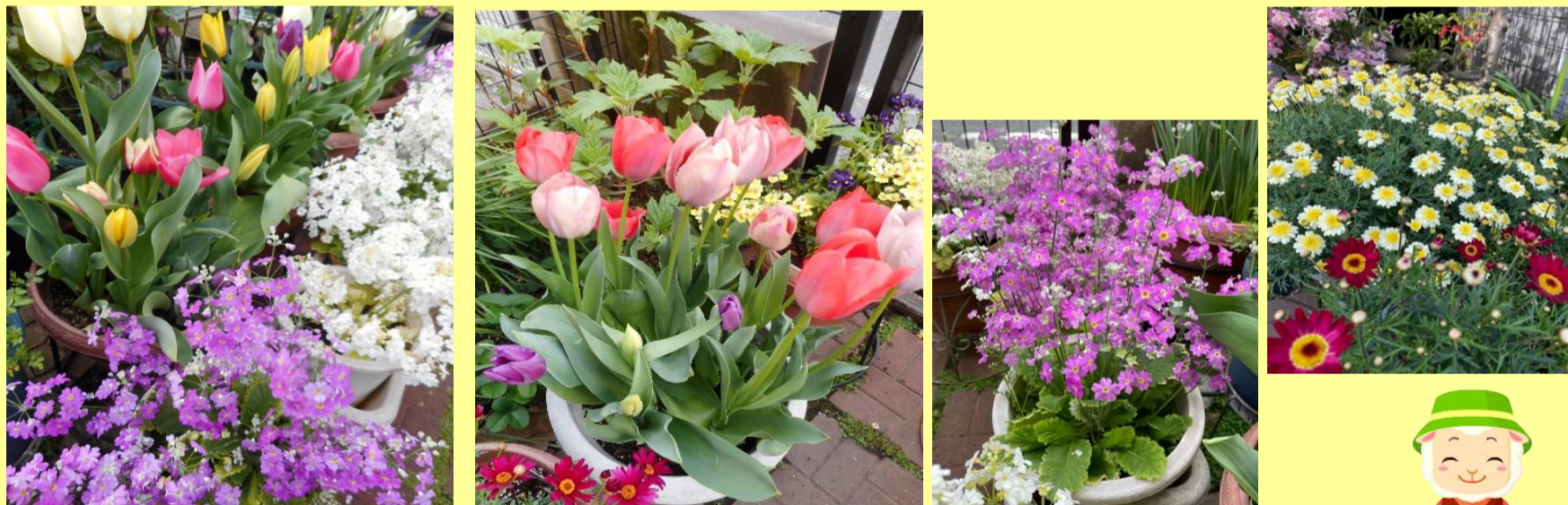
大森西で3月に撮影した桜の写真です📷 下の写真は、色とりどりのお花を育てている方から許可を得てパチリと撮影させていただきました。ご協力ありがとうございました。